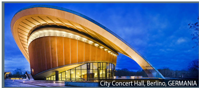
City Concert Hall, Berlino, GERMANIA